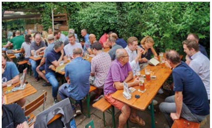
Ebenso wichtig das gemeinsame Abendessen. In Karlsruhe im Brauhaus Vogel an einem grandiosen Sommertag. Den Teilnehmern hat es gefallen und so konnten auch Kontakte geknüpft und erweitert werden.