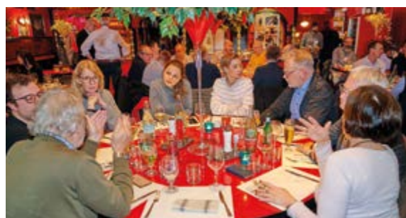
Im Traditionslokal „Old Commercial Room“ erwarteten uns Hamburger Spezialitäten und ein sehr kommunikativer Abend zum Ausklang der Tagung.