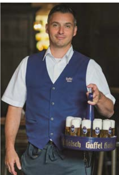
In Köln wurde selbstverständlich das passende Bier serviert: das Kölsch

Die Anuga FoodTec deckt als weltweit einzige Fachmesse alle Aspekte der Lebensmittelproduktion – von der Verarbeitung bis hin zur Verpackung und Lagerung – ab und das über sämtliche Food-Branchen hinweg. Für die globale Ernährungsindustrie ist die Anuga FoodTec die führende Informations- und Beschaffungsplattform. In der diesjährigen Leitmesse, die sich speziell mit technologischen Innovationen und Fortschritten in der Lebensmittelverarbeitung befasst, nahm der DSIV eine aktive Rolle ein, insbesondere im Hinblick auf die Förderung von Young Professionals.