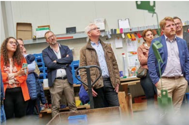
Wie immer waren die Zuhörer bei diesem interessanten Firmenbesuch eines Mitgliedsunternehmens äußerst aufmerksam