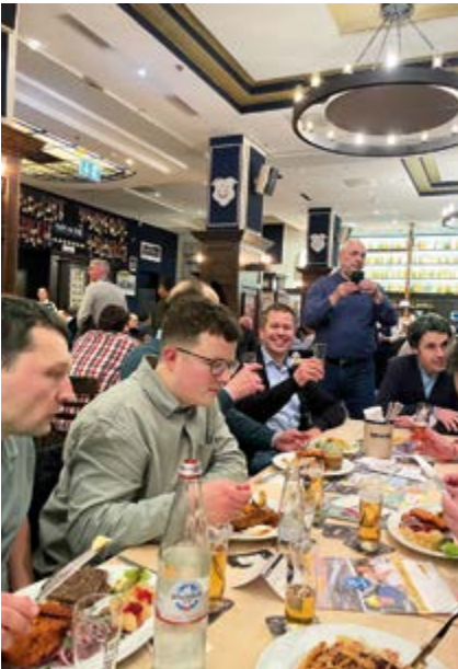
An diesem DSIV-Stammtisch unter realen Bedingungen war für reichlich Essen und Trinken gesorgt