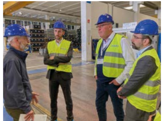
Eurotubi führte die DSIV-Mitglieder durch ihre Produktionsstätte

bende Zeit des Anreisetags für einen Besuch im Ferrari-Museum. Am Freitag, den 28. April, setzten wir unsere Firmenbesichtigungstour fort. Zuerst besuchten wir Eurotubi in Carbonara di Po. Anschließend ging es weiter nach Cavezzo, wo wir unser Mitglied MIX besuchten und nach italienischer Tradition ausgiebig zu Mittag aßen. Der nächste Halt war bei der Firma COMAV s.r.l. in Sant'Agostino. Am Sams-