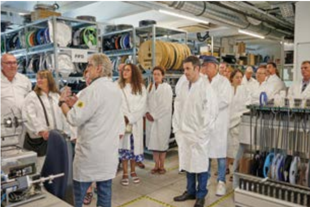
Nach der Einkleidung mit weißen Kitteln durften wir die Produktion der Leiterplattenbestückung besichtigen