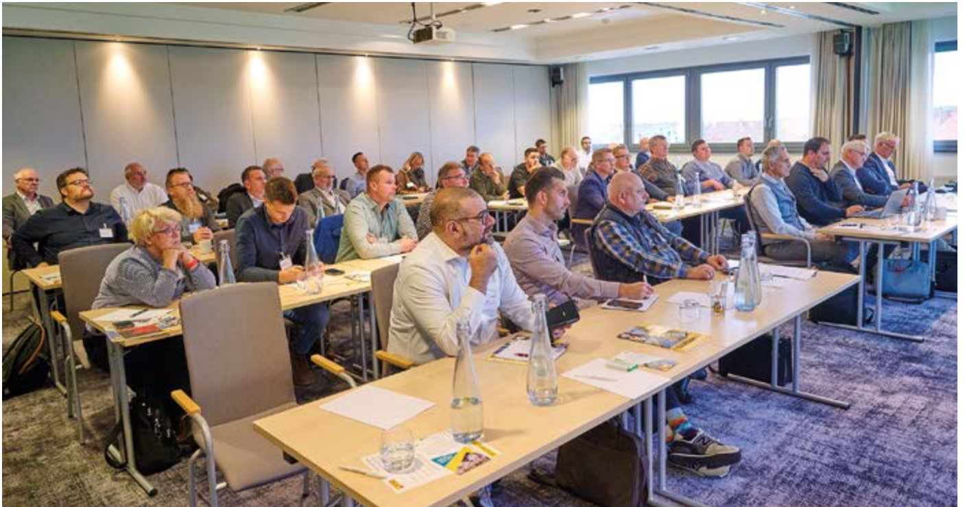
Volle Konzentration auch noch beim letzten Vortrag