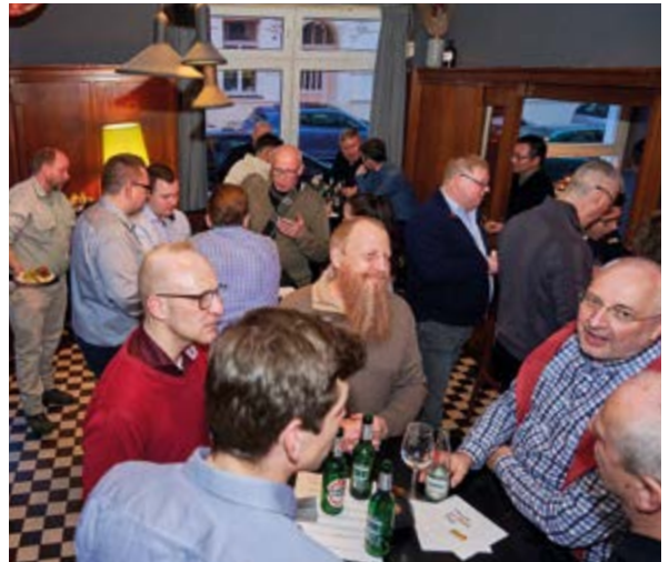
Zufriedene Gesichter in der Runde, schöner kann ein solcher Abend nicht sein