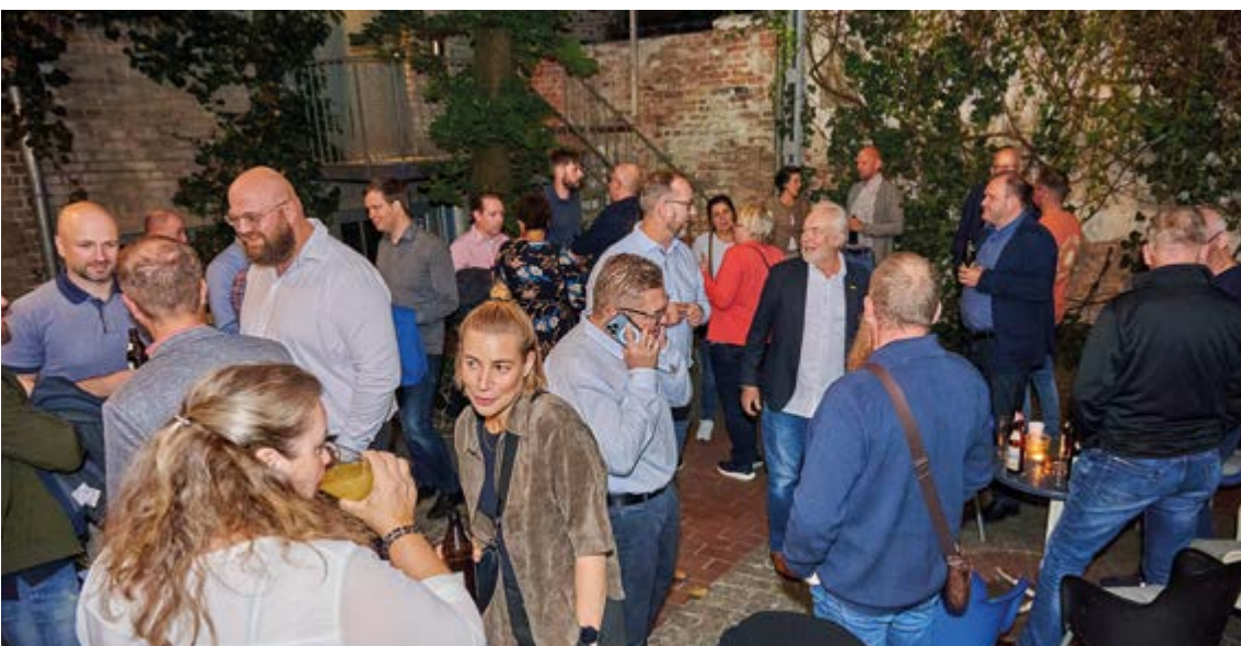
Das Wetter hat gut mitgespielt und uns vor räumlicher Überfüllung gerettet. Auch draußen war es wunderschön und kommunikativ.