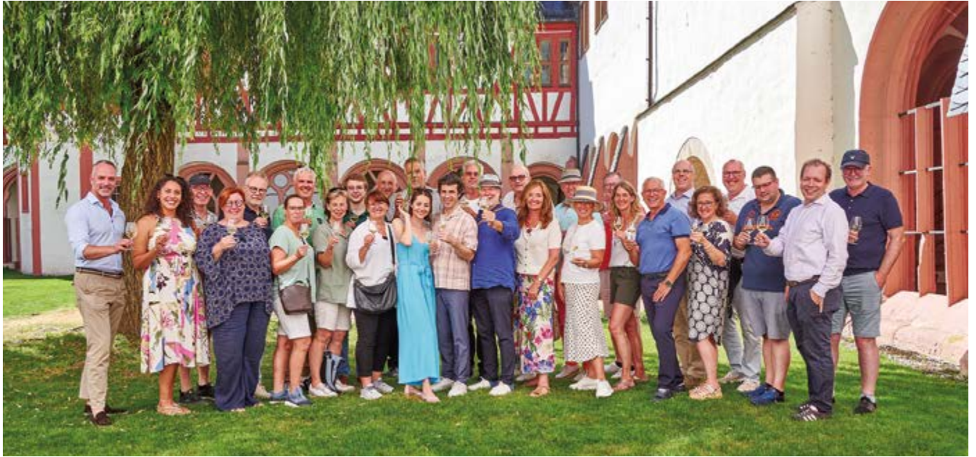
Das traditionelle Gruppenfoto während des Sommerfestes entstand im Garten des Kreuzgangs des Klosters Eberbach im Rheingau