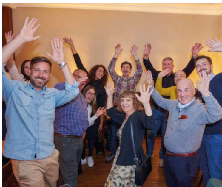
Eine ausgelassene Stimmung ist kaum deutlicher zu zeigen