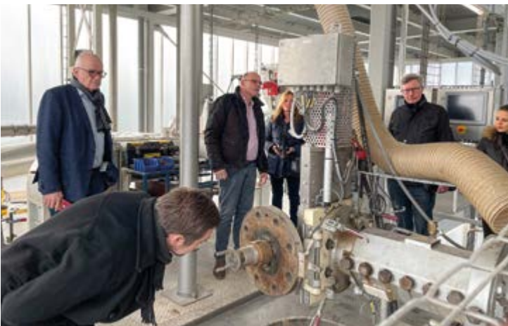
Es blieben keine Fragen offen bei einer Produktionstechnik zum Anfassen