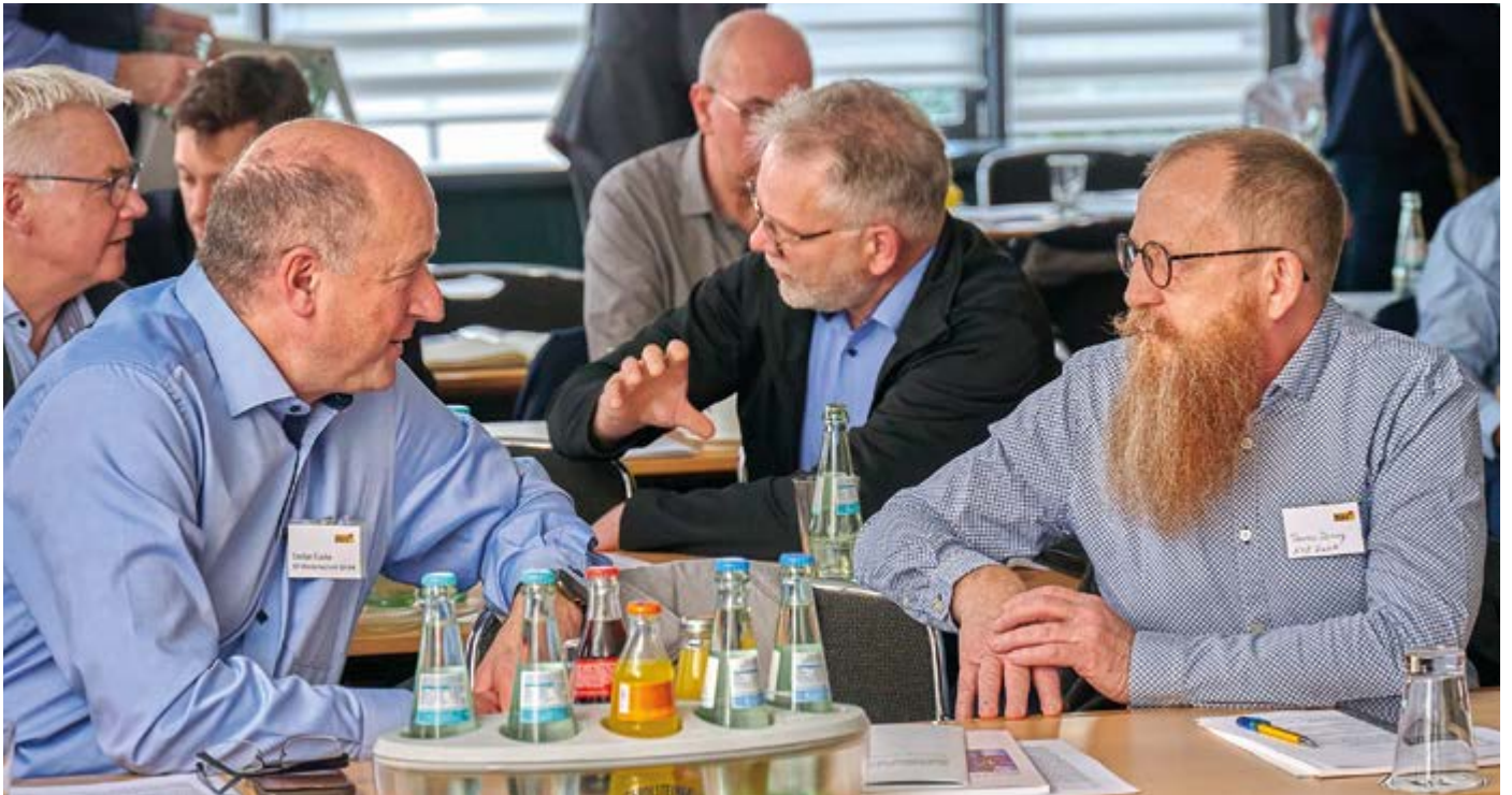
Für fachlichen Austausch wurde während der Pausen genügend Zeit gelassen