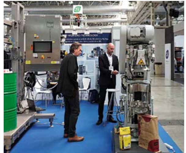
Letzte Inspektion der Exponate bevor die Messebesucher eintreffen

Das Jahr 2024 begann für uns mit einem verstärkten internationalen Engagement. Wie unseren Mitgliedern bekannt ist, unterhalten wir enge Beziehungen zu Schüttgutverbänden in Spanien (TECHSOLIDS), England (SHAPA) und den Niederlanden (MACHEVO). Diese internationalen Partnerschaften wurden insbesondere durch unsere Teilnahme an der Exposolidos in Barcelona im Februar weiter intensiviert. Dort hatten wir die Möglichkeit, unsere Mitglieder zu vertreten, unsere Präsenz zu zeigen und wertvollen Austausch mit dem spanischen Verband zu pflegen.