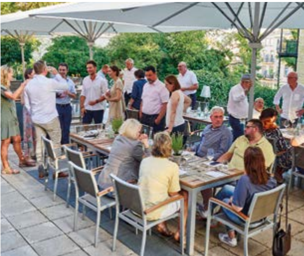
Bei strahlendem Sommerwetter fand man Zeit für Gespräche, bevor man gruppenweise zum Weinfest in die Wiesbadener Innenstadt aufbrach. Zu dieser Zeit fand dort das größte Weinfest Deutschlands mit über 110 Ständen statt.