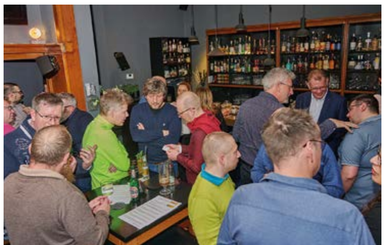
Dichtes Gedränge vor der Bar. Gleich läutet die Glocke zum letzten Getränk. Heute schon wollen wir alle auf der Messe unsere Leistungen für die Besucher aus der Industrie präsentieren. Also: FEIERABEND