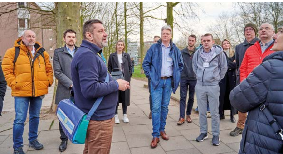
Bei den Stadtführungen in Hamburg gibt es immer wieder Neues zu entdecken