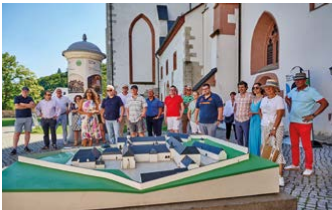
Zunächst wurde sich ein Überblick über die Klosteranlage verschafft

Am Freitag, den 16. August 2024, feierte die DSIV-Familie gemeinsam mit ihren stets willkommenen Gästen das alljährliche Sommerfest. Wie gewohnt fand das Fest auf der Sommerterrasse des Hotels Oranien in Wiesbaden statt und bot wieder ein abwechslungsreiches und kommunikatives Programm. Begleitet wurde der Tag durch das beste sommerliche Wetter, welches wir uns gewünscht hatten.