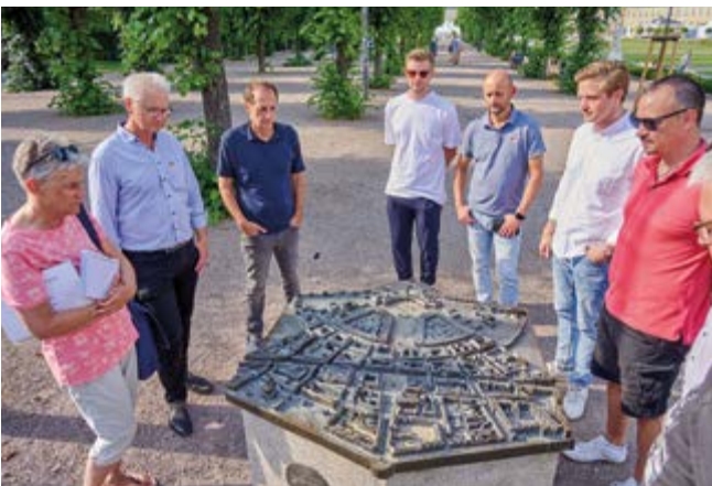
Karlsruhe kannten doch einige der Teilnehmer nicht. Die Befragung, ob Stadtführungen ein guter Teil des Programms sind, wurde von 80 % für gut befunden.