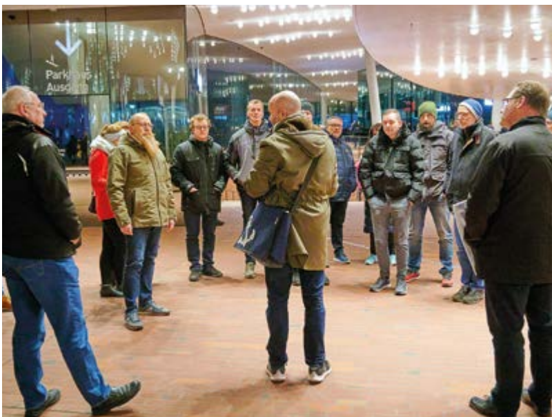
Eine Stadtführung gehört obligatorisch zum Programm. Auch die Besichtigung der Elbphilharmonie stand auf dem Programm.