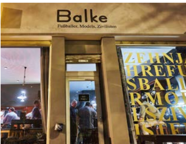
Wieder einmal war das Balke die angesagte Location