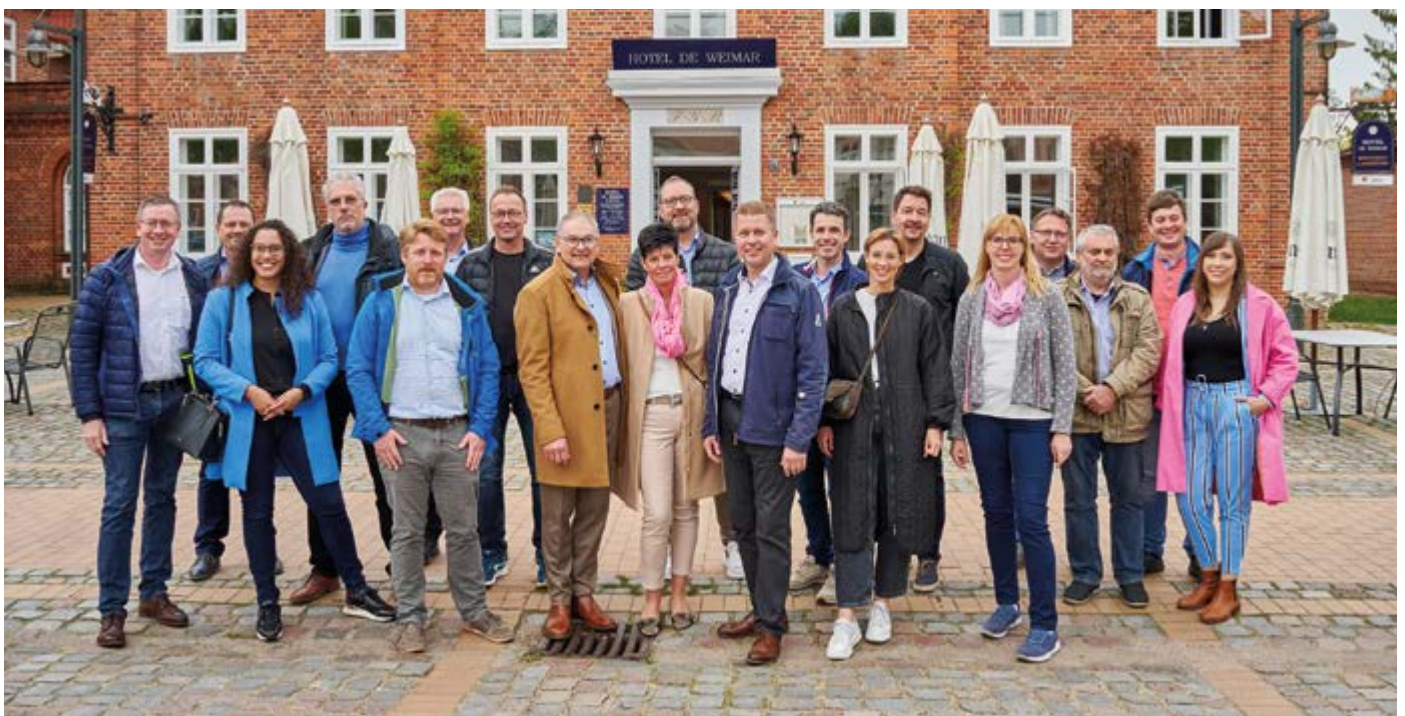
Großes Interesse beim Besuch der Firma Ing. Siegmund Henning Anlagentechnik GmbH unseres Präsidenten in Warlow

Der Abend wurde mit einer Stadtführung durch Schwerin und einem Dinner im außergewöhnlichen Restaurant „CUBE BY MIKA“ abgerundet, welches der Kommunikation und dem Netzwerken diente.