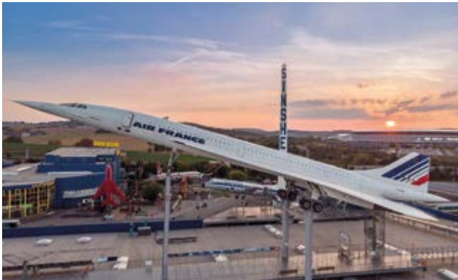
Das Museum ist ein echter Anziehungspunkt für Technikfans