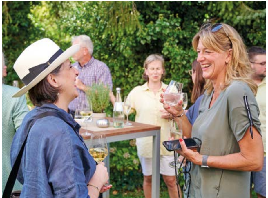
Die ersten Gäste treffen zum Sommerfest auf der Terrasse des Hotels Oranien in Wiesbaden ein. Eine grüne Oase inmitten der Stadt. Man begrüßte sich herzlich und nahm schon mal einen Empfangstrunk, bevor es dann weiterging zu der Exkursion zur Firma Eckelmann AG.

Der Höhepunkt für einige war sicherlich der Besuch der Weinwoche, zu dem wir abends in angenehmer Gruppengröße aufbrachen. Es zeigte sich wieder, welche hervorragenden Gelegenheiten es gibt, die Bindungen innerhalb unserer Community zu stärken. Es hat einfach Spaß gemacht.