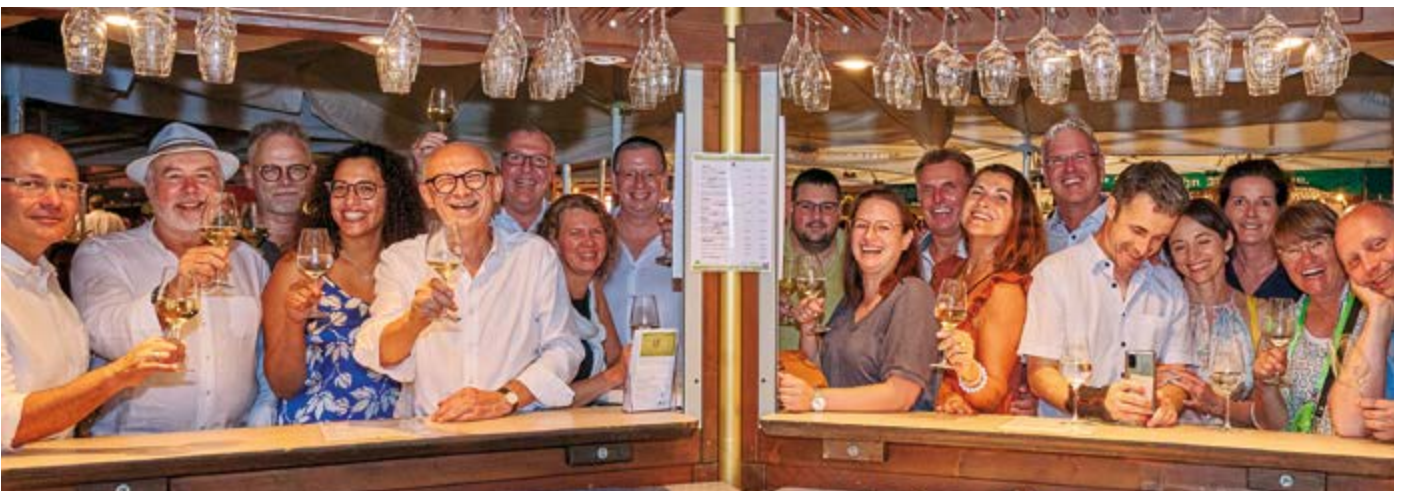
Das Fazit der Gruppe: „Wir werden definitiv wieder zum Sommerfest kommen und im Anschluss natürlich auch die Wiesbadener Weinwoche besuchen.“