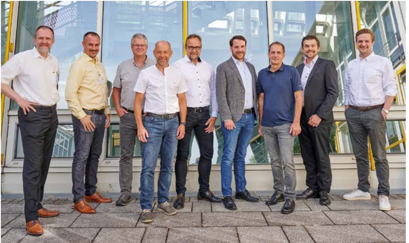
Die Helden des DSIV-Silotages