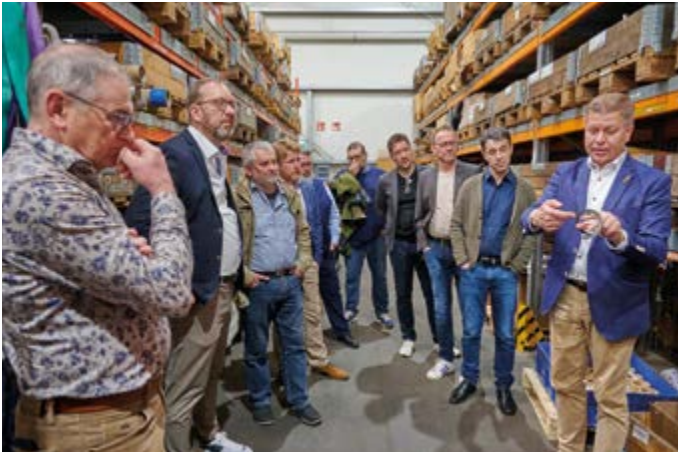
Den interessierten Zuhörern wurde bis ins kleinste Detail Antworten gegeben