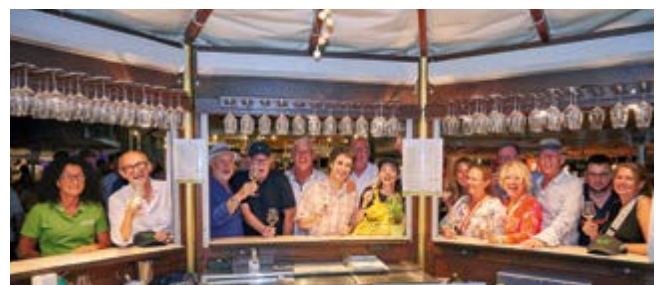
Der Abend fand seinen Ausklang auf der Wiesbadener Weinwoche