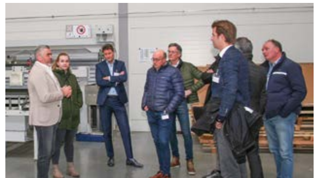
Dinnissen BV, im nahegelegenen Sevenum, hat enge Verbindungen zum Feed Design Lab. Daher stand selbstverständlich eine Firmenbesichtigung, inklusive Präsentation und einem Rundgang durch die Produktion, auf der Agenda.