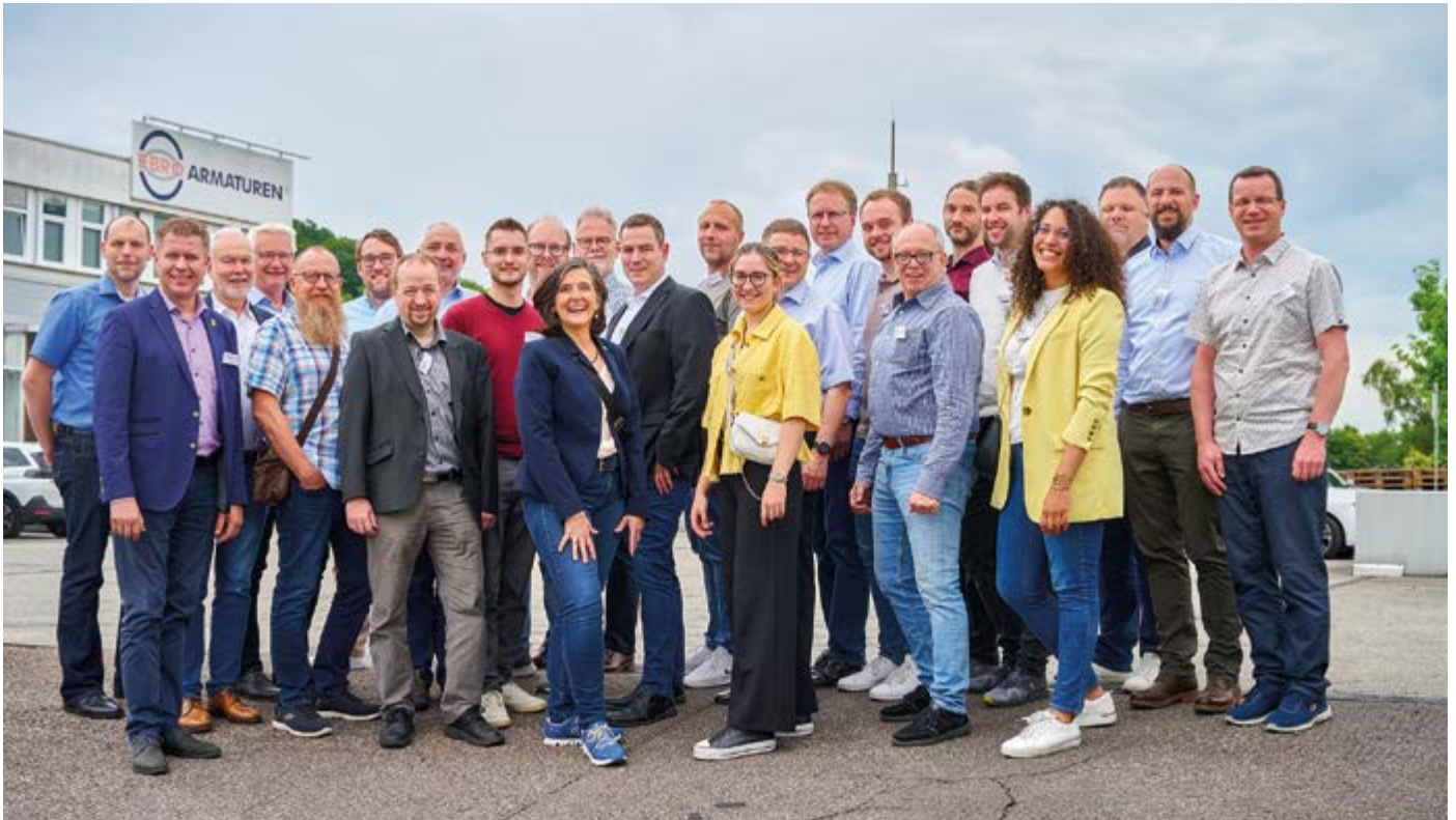
Man sieht es in den Gesichtern – ein super Tag für die Besucher der DSIV-Veranstaltung in Hagen