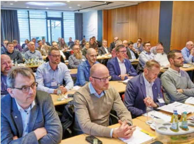
Wieder einmal ein volles Haus und mehr durften auch nicht