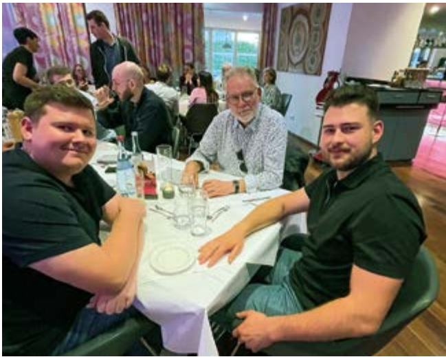
Regel Austausch der jungen aktiven DSIV'ler