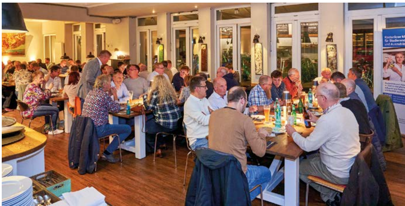
Mit über 90 Teilnehmern bis zum letzten Platz gefüllt – das „Schönes Leben“ in Dortmund