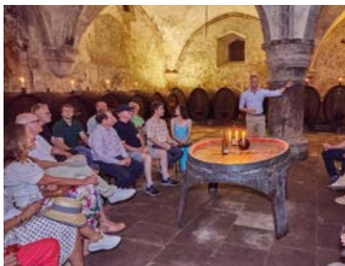
Ein erster Wein wurde im Gewölbekeller serviert

Am Freitag, den 16. August 2024, feierte die DSIV-Familie gemeinsam mit ihren stets willkommenen Gästen das alljährliche Sommerfest. Wie gewohnt fand das Fest auf der Sommerterrasse des Hotels Oranien in Wiesbaden statt und bot wieder ein abwechslungsreiches und kommunikatives Programm. Begleitet wurde der Tag durch das beste sommerliche Wetter, welches wir uns gewünscht hatten.