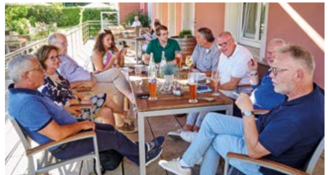
Nach der Weinprobe im Kloster erst einmal ein Bier auf der Hotelterrasse