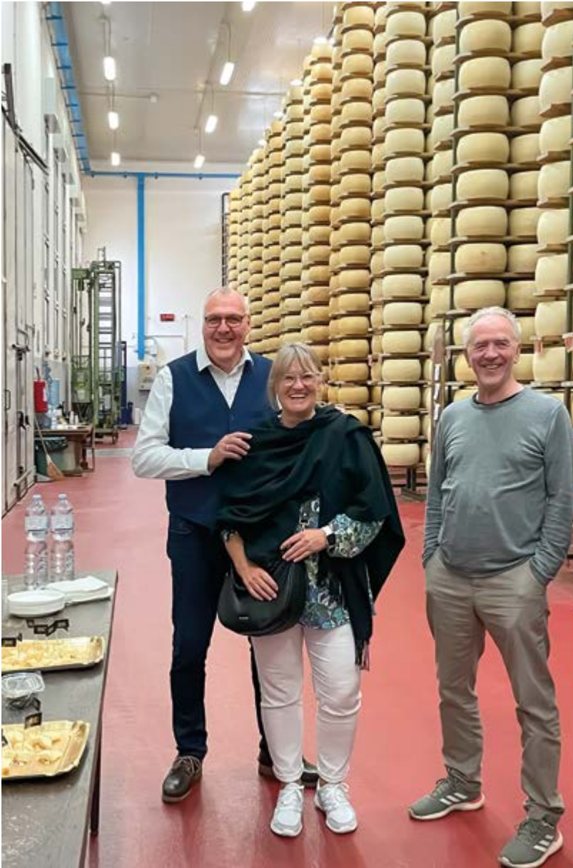
Der Besuch einer Parmigiano Reggiano-Produktion war ein Teil der touristischen Highlights