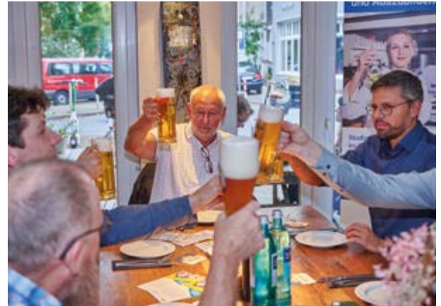
Messeaufbau beendet – jetzt erst mal ein Bier

Am Montag, den 08. Oktober 2024, feierte die DSIV-Familie gemeinsam mit ihren stets willkommenen Gästen das Kick-off zur Messe SOLIDS.