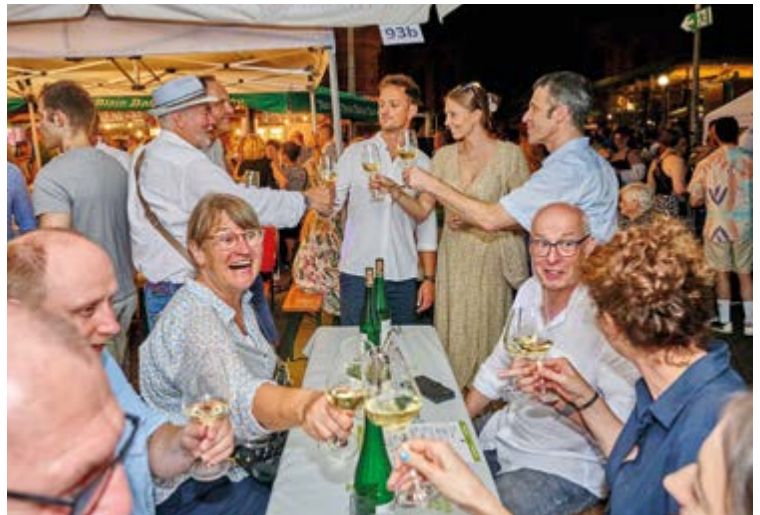
Der DSIV hatte beim Weingut Schloss Vollrads Tische reserviert. Trotz des großen Gedränges fanden wir unseren Platz, um nach dem Barbecue und dem gemütlichen Ausklang auf der Sommerterrasse den Besuch beim Weinfest fortzusetzen. In fröhlicher Runde wurde sofort ein Toast ausgesprochen.