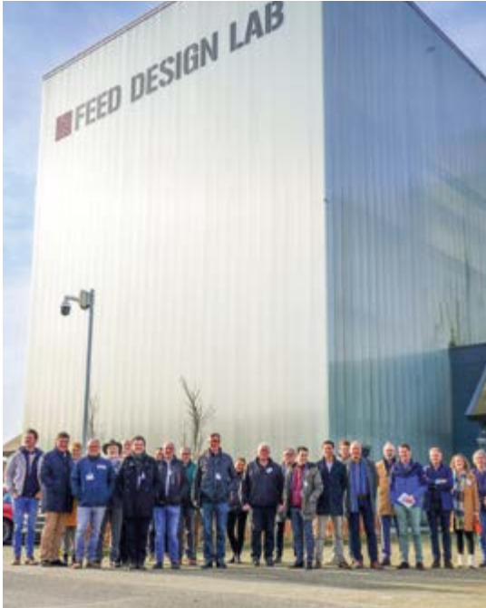
Gruppe 1 traf sich vor dem FDL Feed Design Lab. Nach einer einführenden Präsentation zu dem Unternehmen wurden zwei Gruppen gebildet.