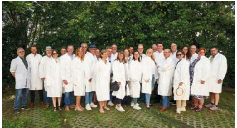
Ein Gruppenfoto zum Abschluss unseres Besuches bei der Firma Eckelmann AG. Irgendwie sieht das sehr sympathisch aus.