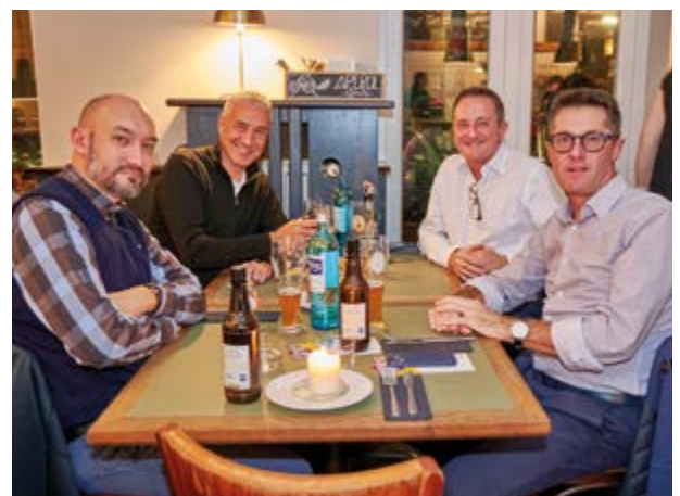
Aus Italien und voller Begeisterung an dem Abend dabei, das Standpersonal von F.Ili Sacchi s.n.c aus Vidigulfo